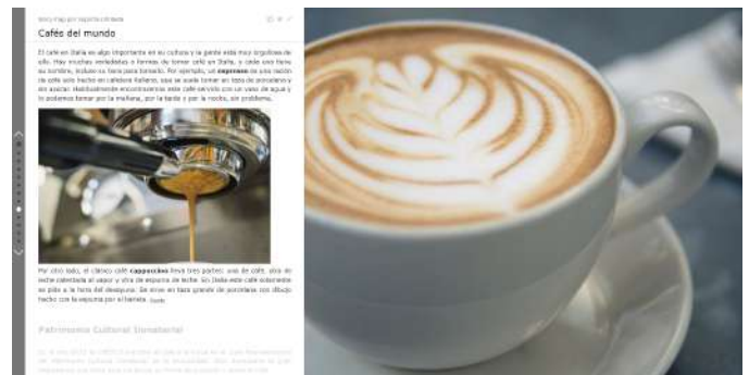
Cafés del mundo Soporta Limitada