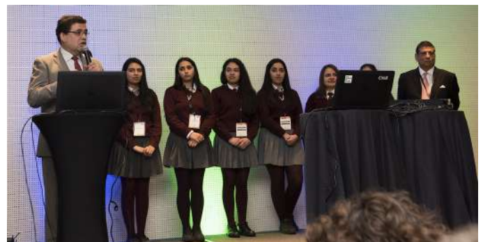
Premiación Ganadores 2018 Liceo de Hotelería y Turismo de Pucón Encuentro de Usuarios Esri Chile 2018