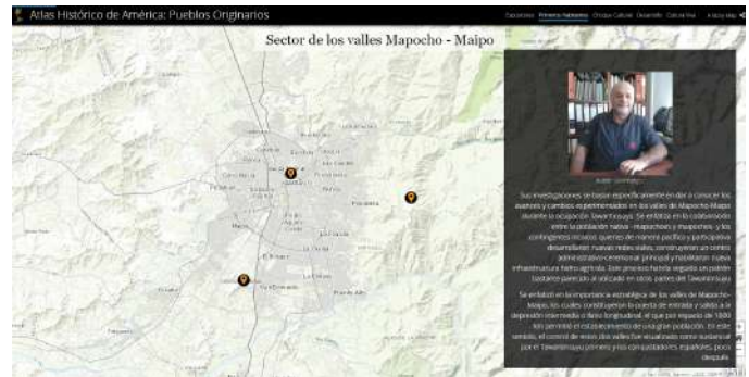
Atlas Histórico de América: Pueblos Originarios ONEMI

La narración de historias a través de mapas es atractiva y nos ayuda a todos a entender mejor el mundo.