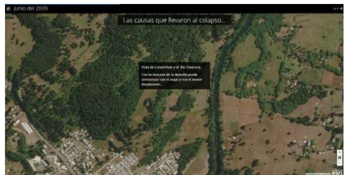
Primer Lugar Año 2018 Junio del 2039 Lago Villarica Liceo de Hotelería y Turismo de Pucón

Los mapas seleccionados serán notificados a los usuarios respectivos y además serán publicados en el sitio web del Encuentro www.usuarios.cl